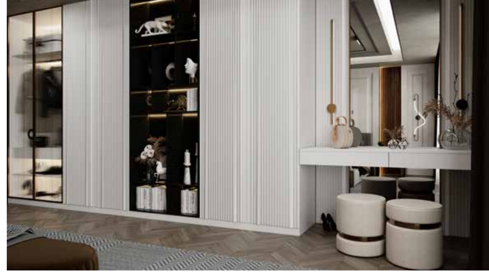
A.Şimşek Konutları Karaman