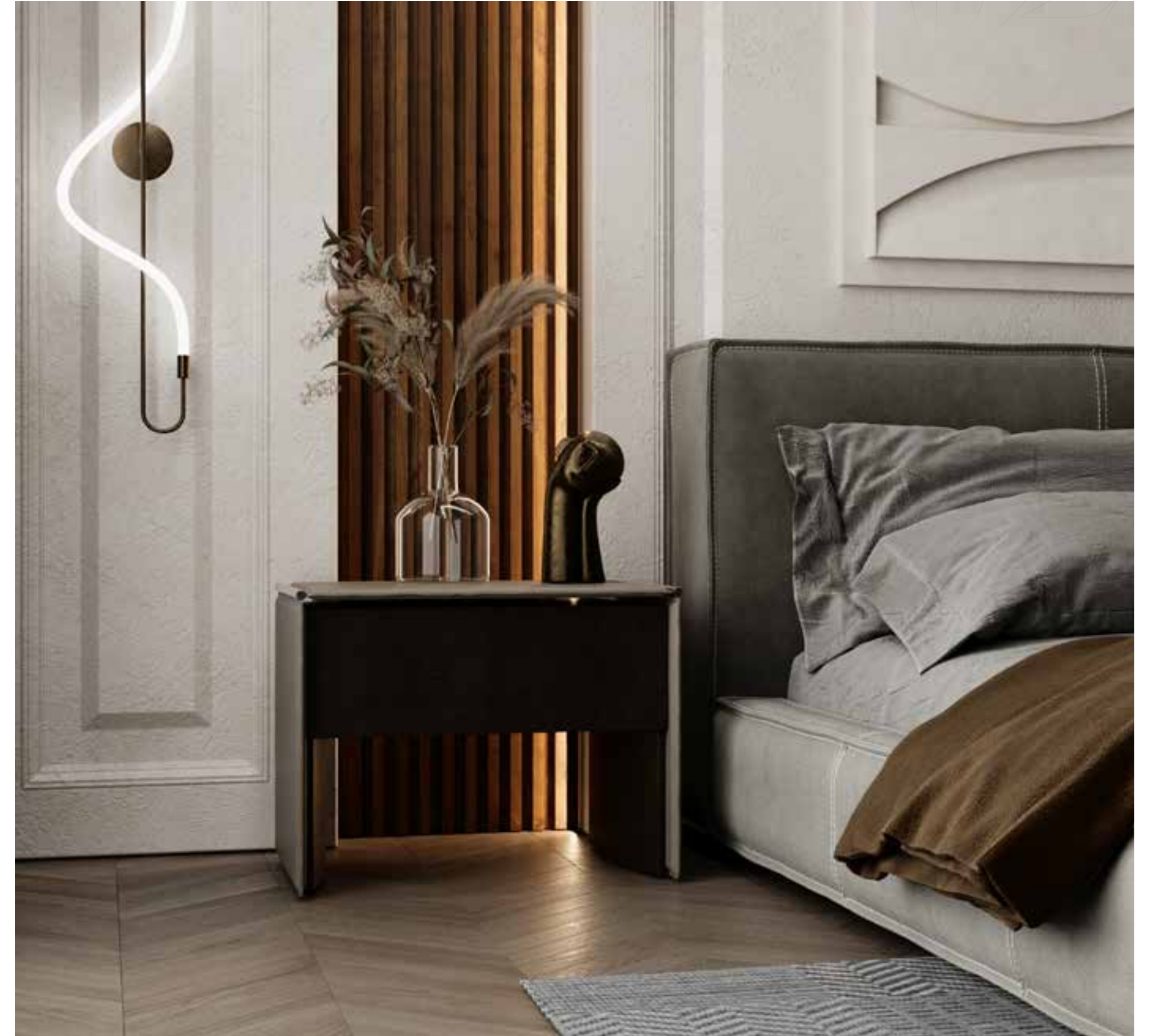
Enlife Konutları Konutları Karaman

Yatak odaları , insanları bir sonraki gün için hazırlayan ve dinlenerek yenilenmelerini sağlayan kısımlardır. Her açıdan sağlığa uygun oda şartları olmalı ve kullanılan mobilyaları da yine ergonomik kullanıma uygun seçilmiş olmalıdır. Her odaya ait mobilyaların doğru yerleştirilmesi, odanın daha geniş, kullanıma elverişli hale gelmesini sağlamaktadır. Aynı şartların yatak odaları için de geçerli olduğunu bilmekteyiz. Yatak odası modellerinin başlıca parçalarının odanın şekline uygun ve en doğru yerlere yerleştirilmesi gerekmektedir.