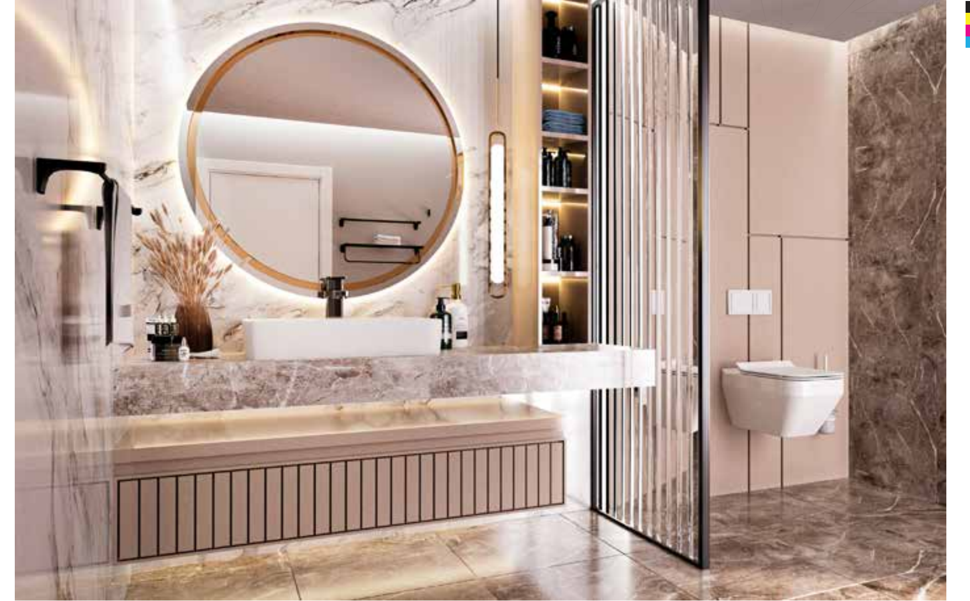
Lyra Konutları Karaman