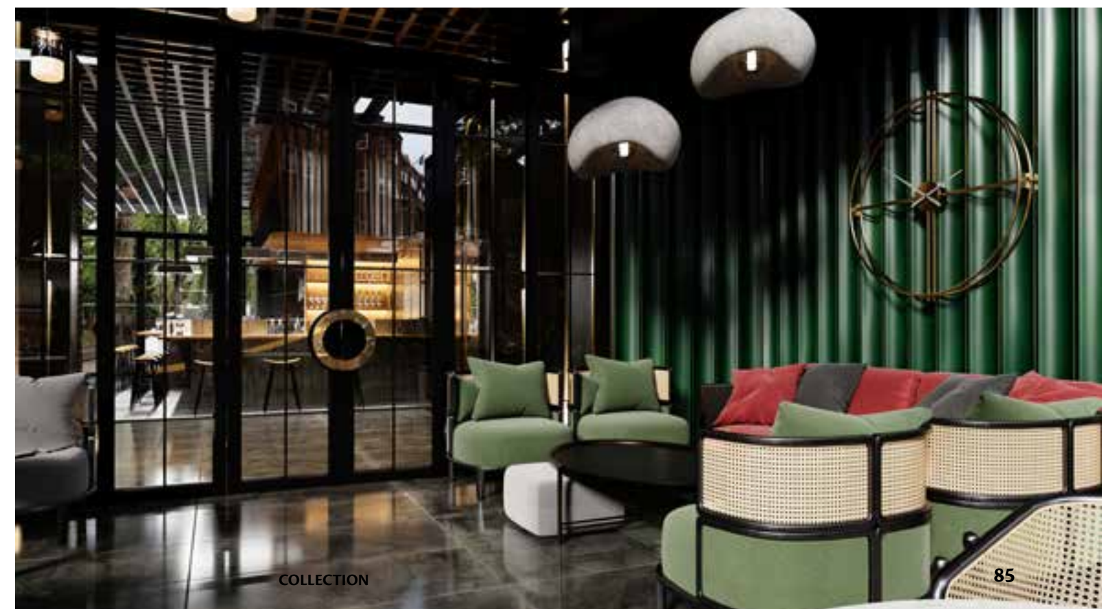
Peet's Coffee Almanya