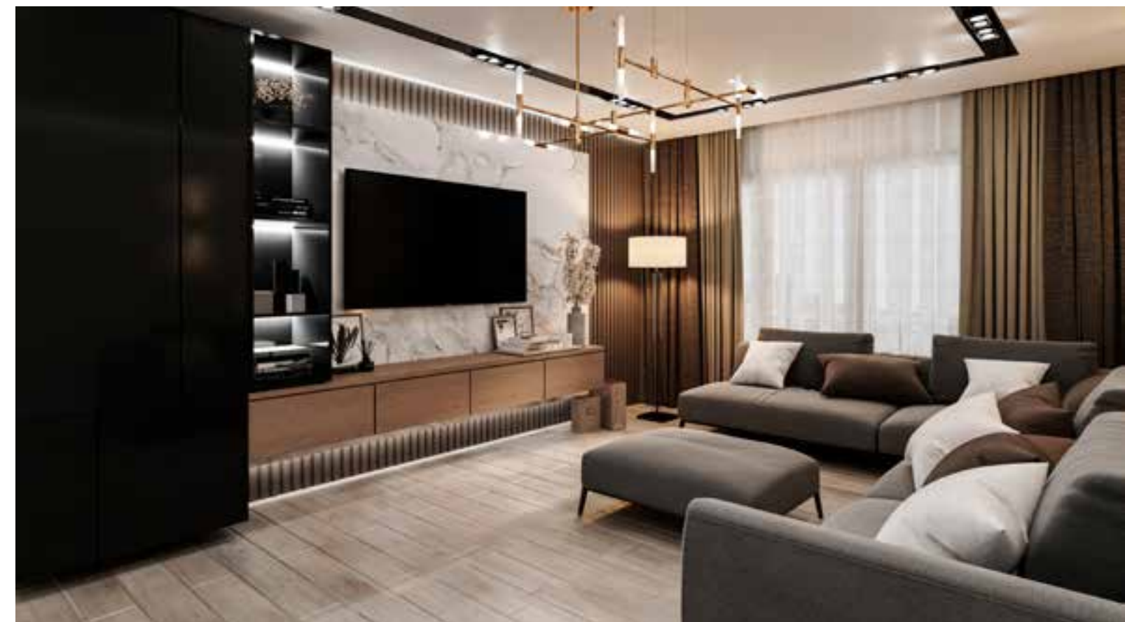
Zirkon Residence Ankara