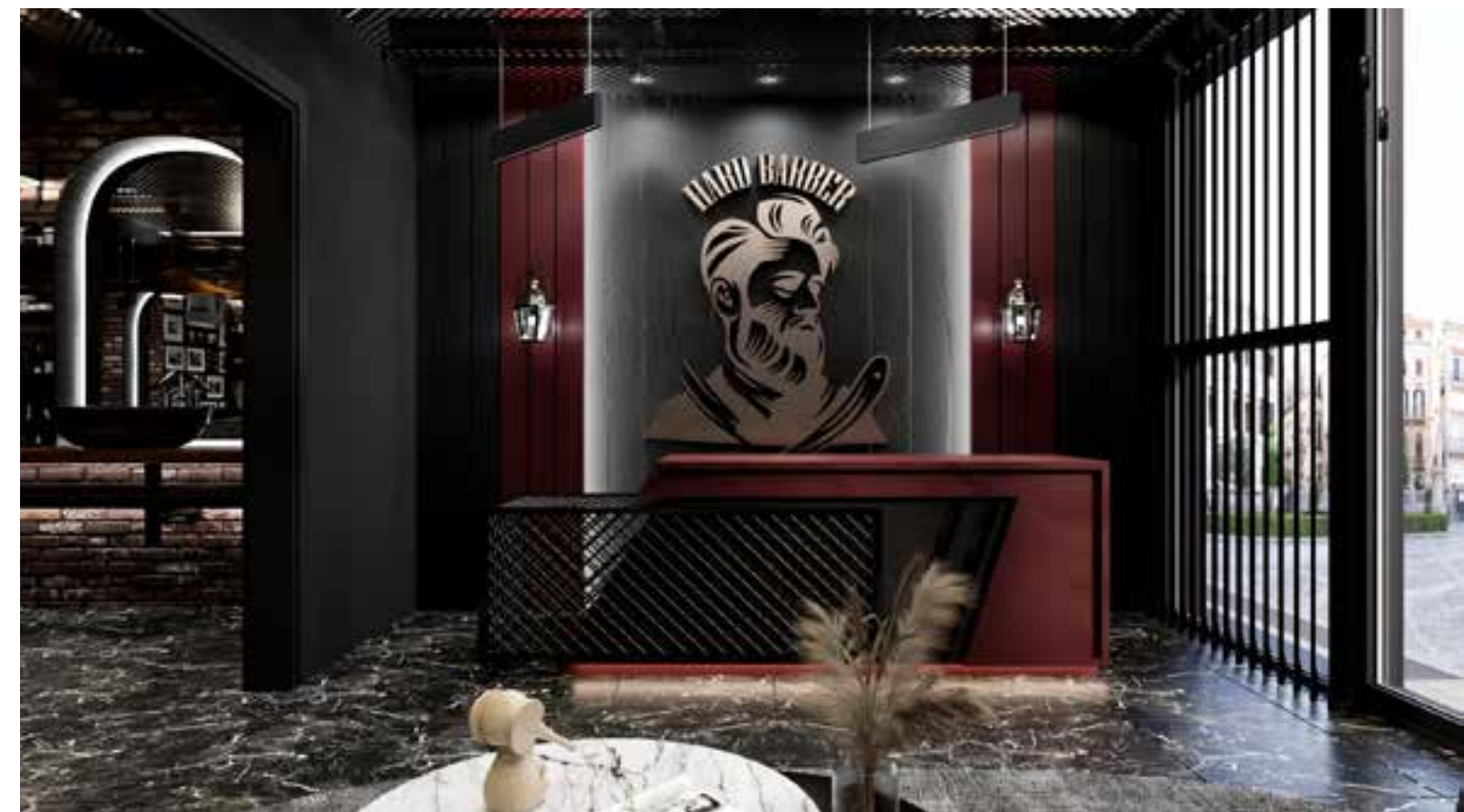
Hard Barber Salonu Almanya