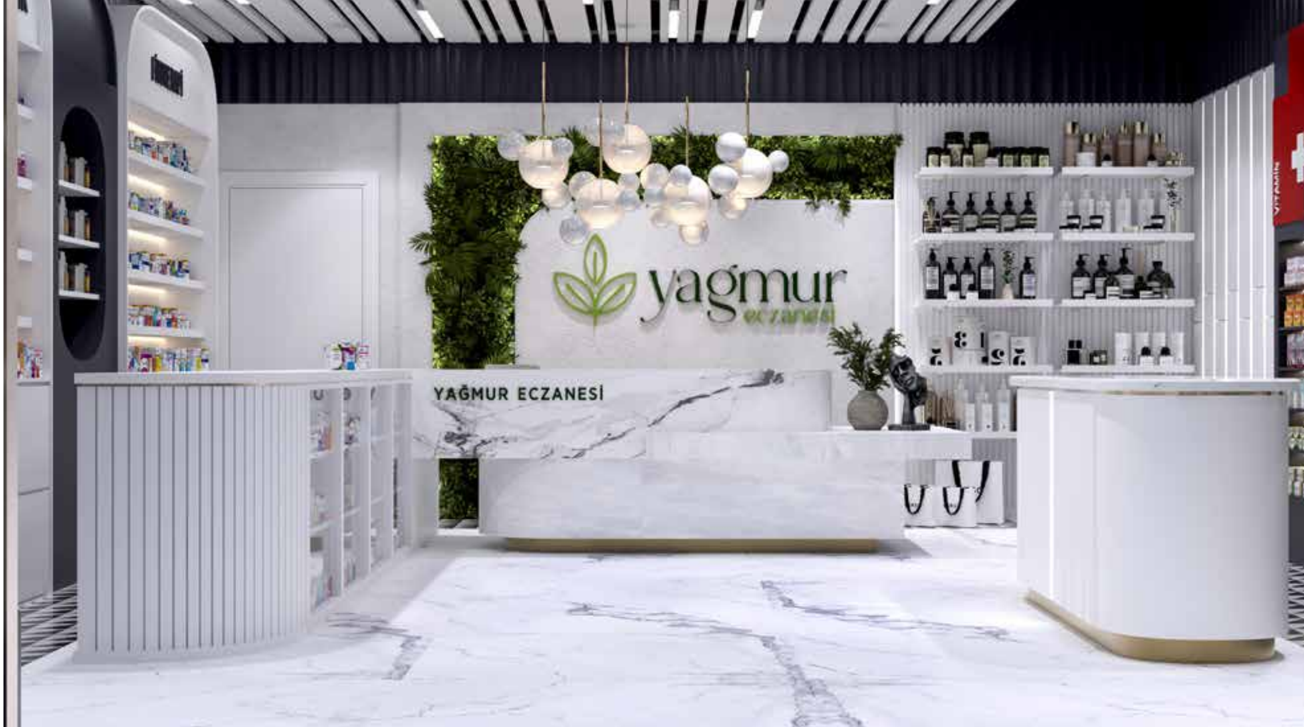
Yağmur Eczanesi Ankara