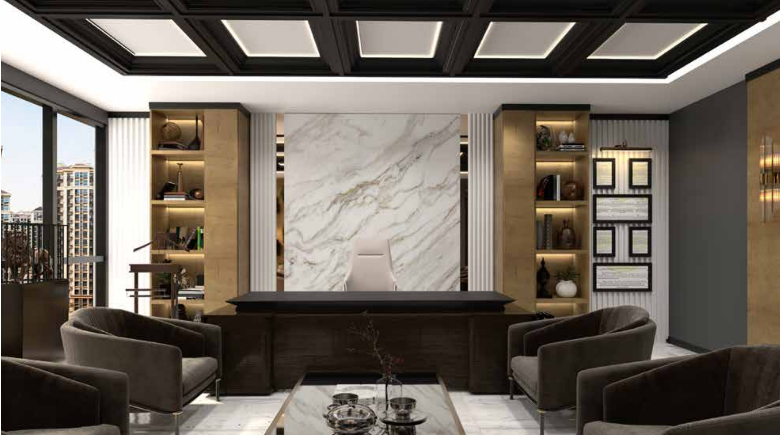
GKZ Avukatlık & Danışmanlık Ankara