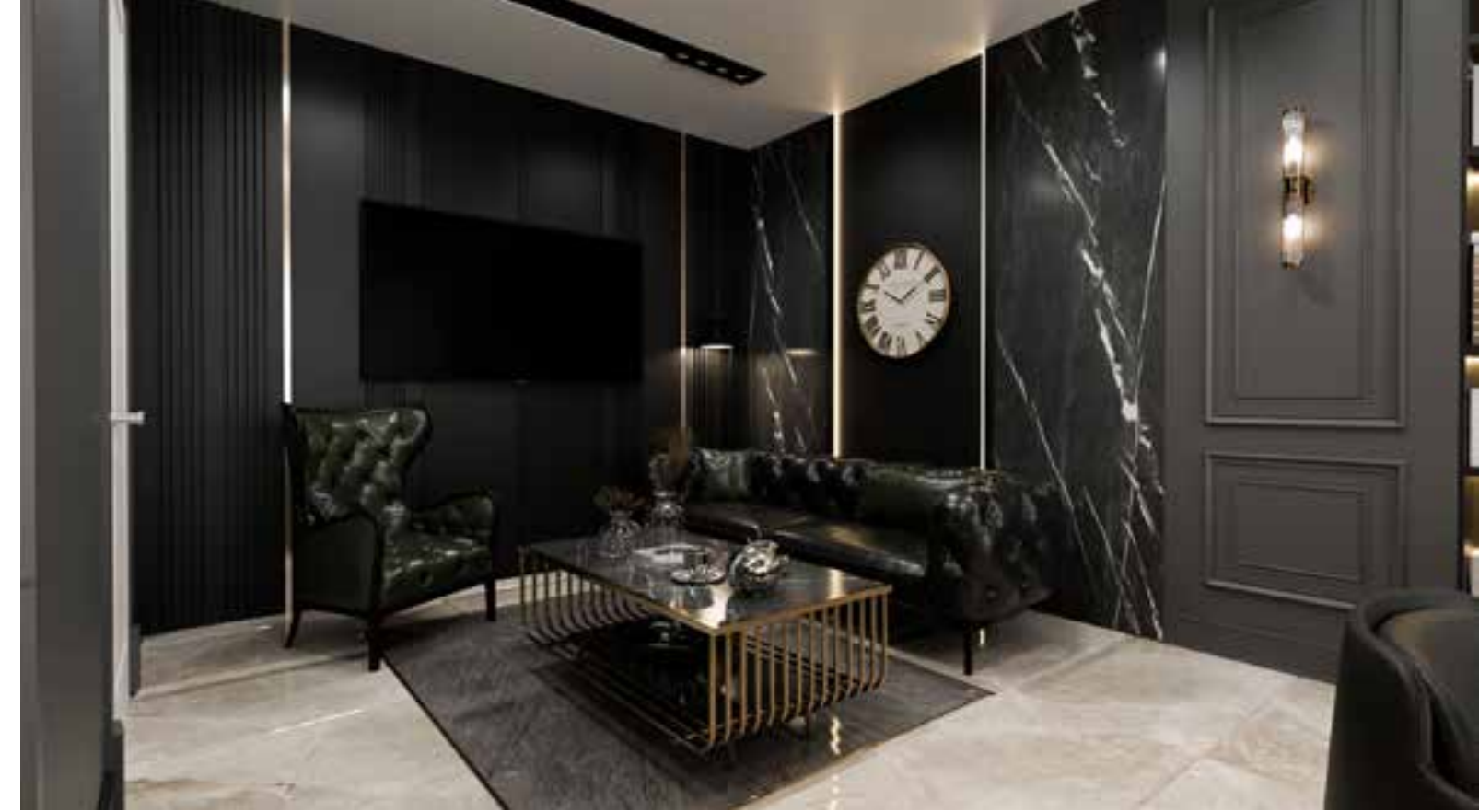
GKZ Avukatlık & Danışmanlık Ankara