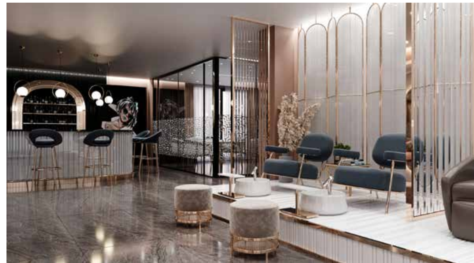
LADY Güzellik Salonu Hollanda